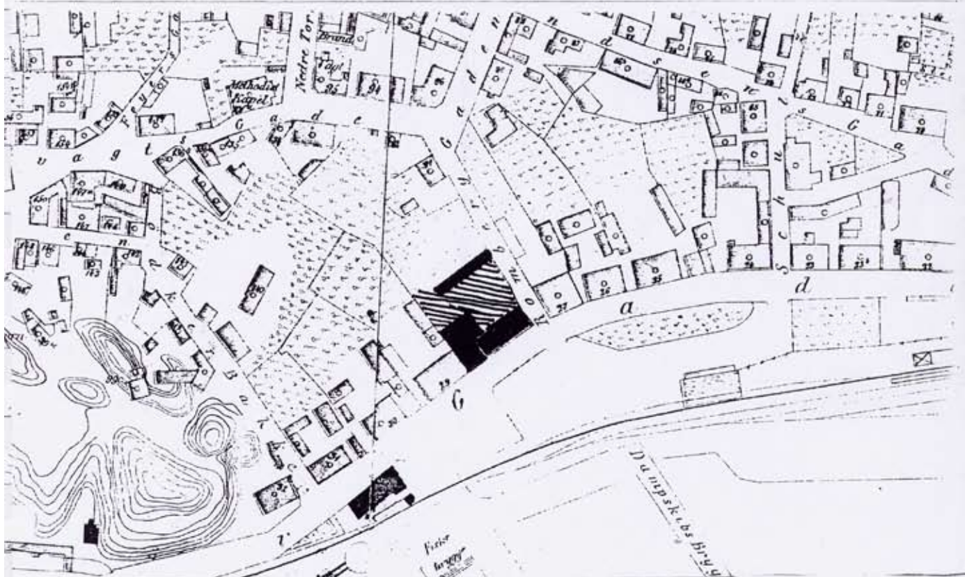
Kart over Larvik 1884. Fortsatt er fasaderekken intakt. Festivitetsstomten er skravert. (Larvikmuseene)