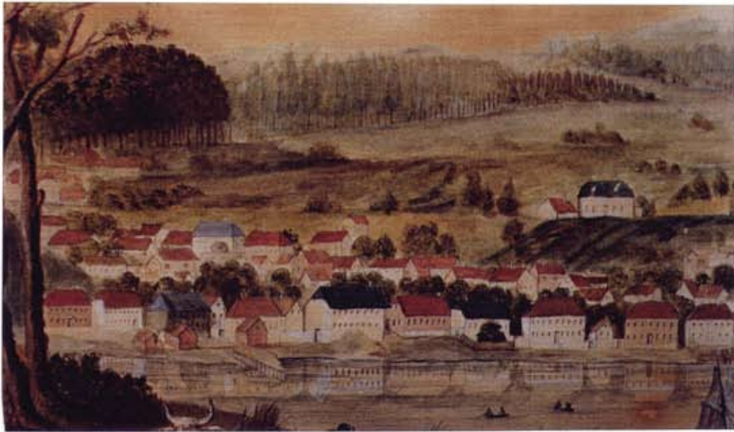
Prospekt av Larvik fra ca.1810 som viser den intakte fasaderekken mot sjøen. Den hvite bygningen med blå taksten, nr. fem fra venstre, er Storgaten 44. Akvarell og gouache av G. Thorbjørnsen. (p. e.)