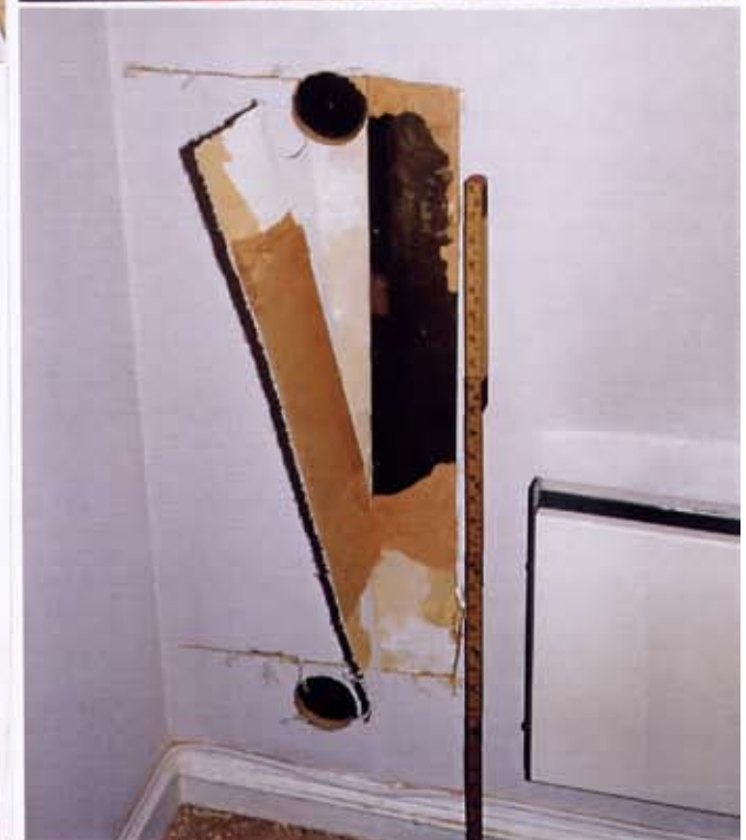
Ø.t.v. tapet og malt håndhøvlet bordhimling. Ø.t.h. biedermeiertapetet på motstående vegg. N.t.v. Marmorerte veggpaneler med sortmalt brystning og malt stenblokkimitasjon fra tidlig 1800-tall, t.v. sjablongdekor ca. 1850, damaskimitasjon. N.t.h. Bygningsarkeologisk metode. Forsiktig hulltagning, måling, beskrivelse og fotografering.