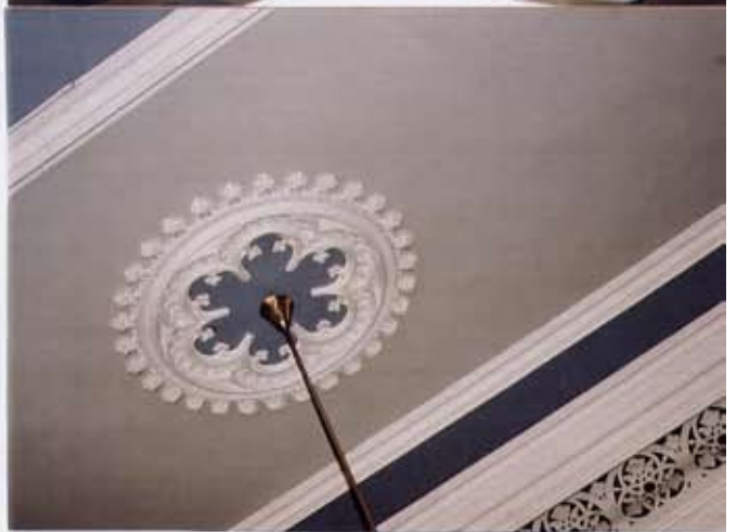
Ø.t.v. detalj av brannmur og frise i Festivitetsalen. Ø.t.h. Paul Dues Festivitetsaal fra 1873-74. N.t.v. Det staselige trappeløpet opp til salen. N.t.h. Detalj av stukkrosett i salen