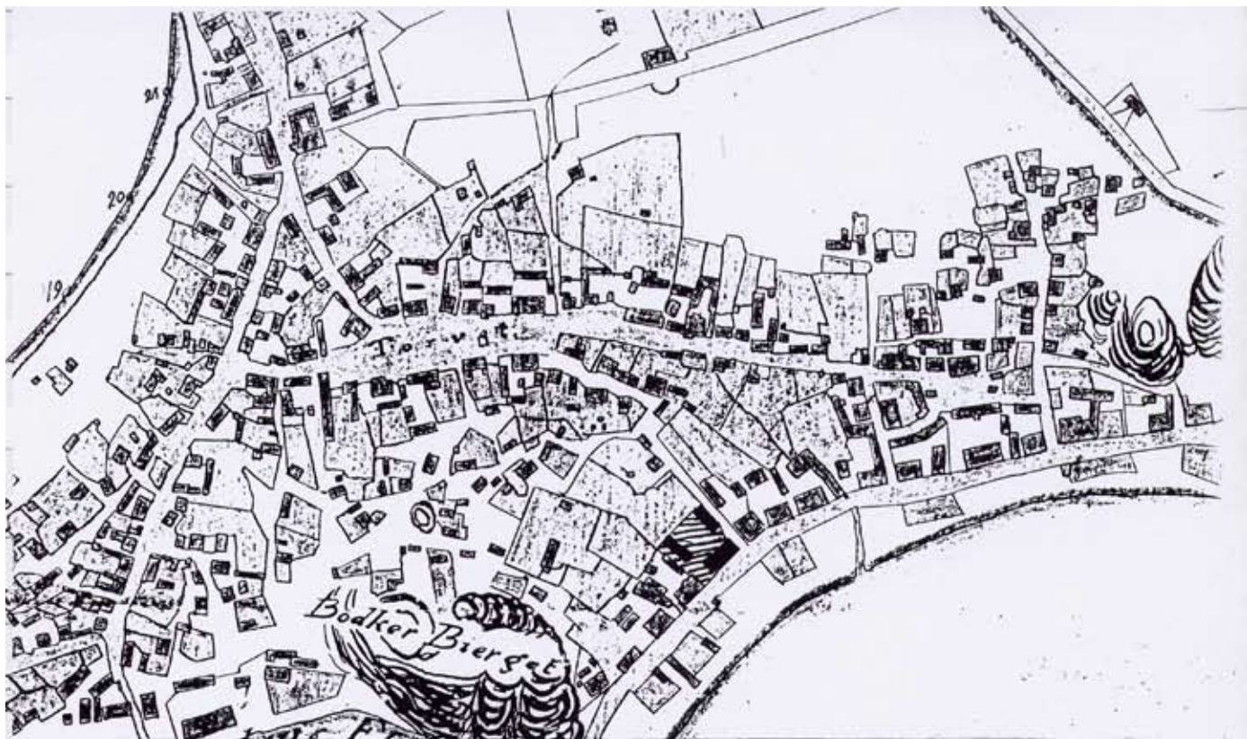
Kart over Larvik 1820 med bygningene langs Storgaten. Storgaten 44 er skravert. (Larviks historie bd. 2)