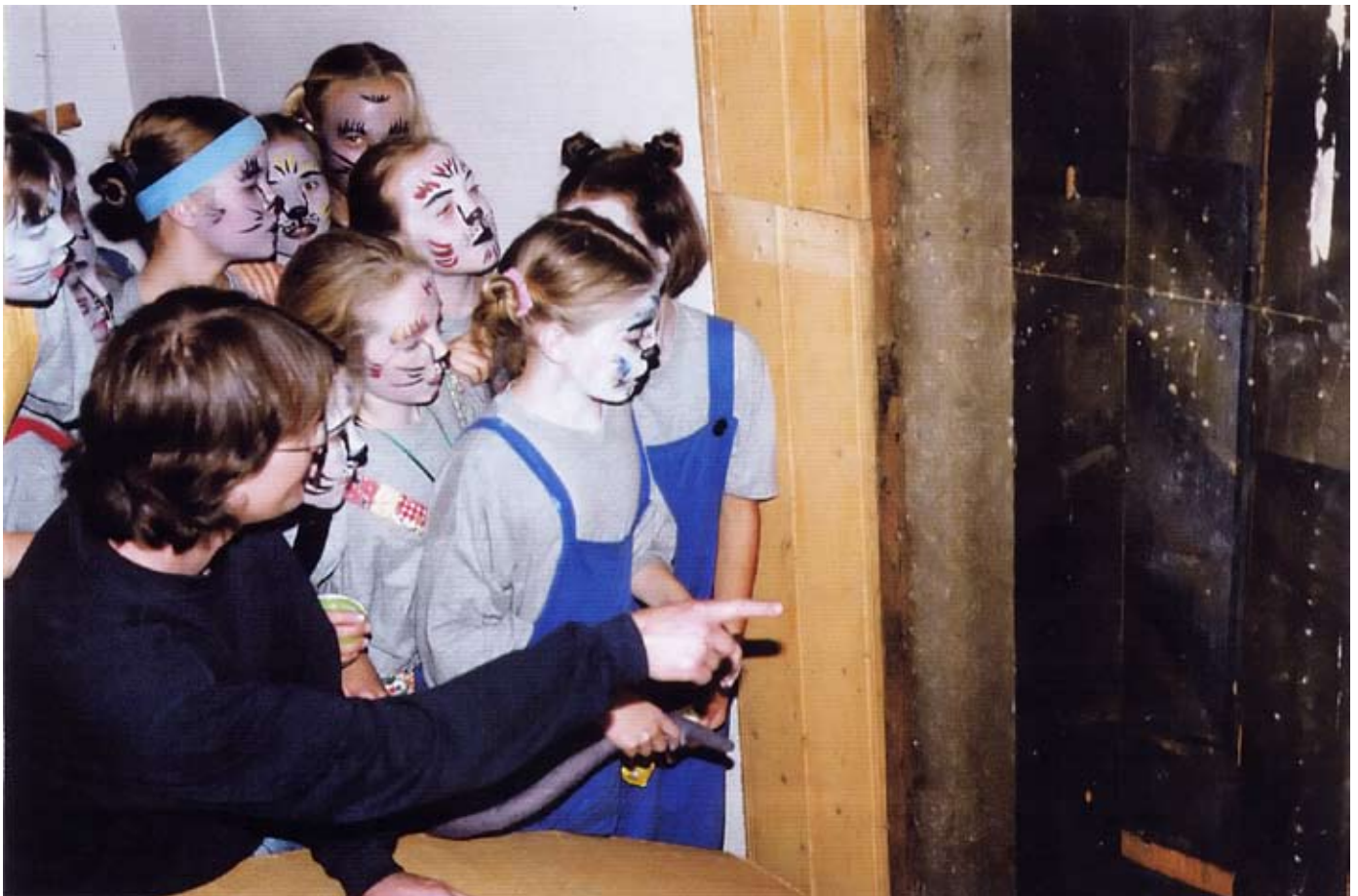
Det oppsiktsvekkende funnet vises umiddelbart frem til interesserte kulturdeltagere som har forestilling i salen.

Fasadene har som mange andre steder gjennomlevd skiftende moteretninger og i rykk og napp endret utforming - men alltid med de gamle opprinnelige bygn-ingskroppene bak det ytre. Går man inn i bakgårdene ser man at det eldste fremdeles lever. Her er intakte, vakre håndgjorte detaljer fra den førindustrielle tid. Unike bygningselementer som kanskje bare har overlevd akkurat her. De gjenspeiler en rikdom og dermed evne til å underholde et høyt utviklet håndverk vi i dag vanskelig kan oppvise maken til. Bak gårdsplassene klatrer fremdeles gamle terrassehager oppover det skrånende terrenget. Støttet opp av solide stensblokker. Gårdsplassene omkranses enda av bakgårdsbebyggelse av høy alder. Disse patrisiergårdene var den gang sentrum for byens økonomiske liv. Denne fasaderekken er i seg selv, som helhet unik og høyst bevaringsverdig. Hver tann i denne rekken er av uvurderlig betydning for helheten.